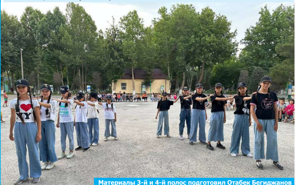
Беседу вёл Отабек Бегиджанов

Подводя итог можно уверенно сказать, что, отправляя ребенка в ДОК «Кимёгар», родители могут быть уверены, что их ребёнок проведет лето не только весело, но и с пользой. Здесь дети научатся не только общаться со сверстниками, но и быть самостоятельными и ответственными.